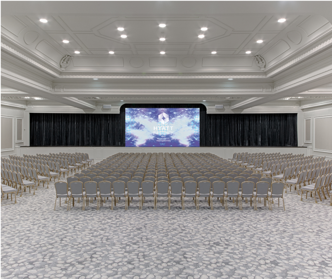
TABLEAU DE CAPACITES